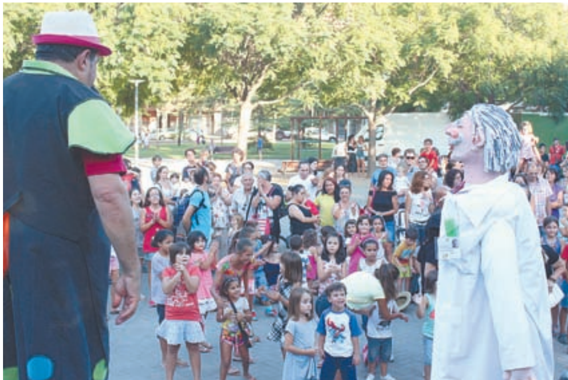
Els espectacles infantils tenen una presència destacada en la programació festiva