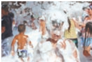
Festa de l'escuma